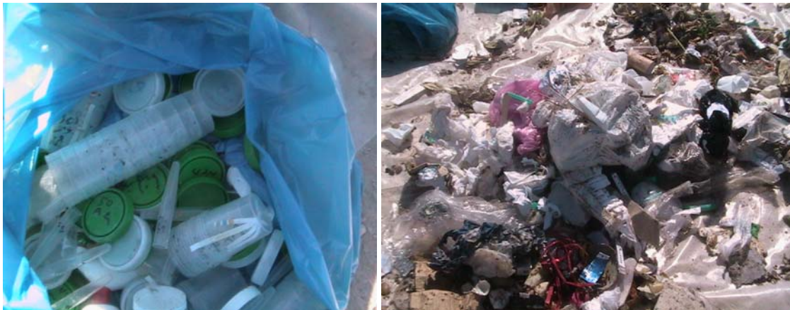
Figure 5- Sacs contenant des déchets hospitaliers

Il faudra noter que durant l'étude de la caractérisation des déchets sur site, des sacs contenant des déchets hospitaliers ( Figure 5 ) ont été retrouvés parmi les sacs de déchets déchargés. Ces sacs étaient collectés avec les déchets ménagers et ne faisaient pas sujet d'une collecte à part. En effet, l'entrée des déchets hospitaliers à la décharge a déjà fait l'objet de plusieurs débats.