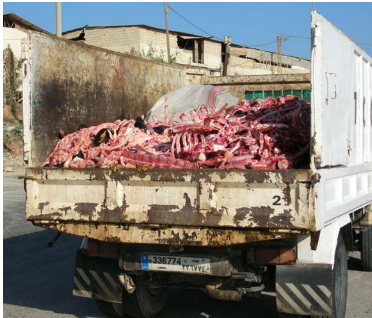
Figure 2- Véhicules de NTCC transportant des déchets de l'abattoir de Saida