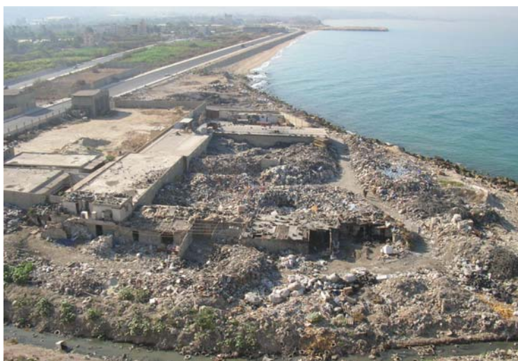
Figure 8- Vue de l'usine de recyclage de plastique du sommet de la décharge

Depuis un an, M. Hariri a trouvé un nouvel endroit pour la collecte de produits en plastique et en fer. Cet endroit est situé à proximité du marché de légumes de Saida (El Hasba). Le fer est vendu à des usines situées à Beyrouth alors que le plastique est transporté à l'endroit actuel de l'usine. Cependant, l'usine actuelle sera déplacée vers ce nouvel endroit vu le projet d'extension de la surface de la décharge jusqu'à la surface occupée par l'usine et qui est en effet une propriété publique. La Figure 8 montre l'usine de recyclage telle que vue du sommet de la décharge.