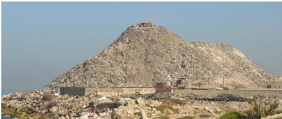
Figure 1- Vue de la partie sud de la décharge de Saida

La décharge de Saida est située au bord de la mer méditerranéenne, non loin du château de la mer de Saida, l'un des monuments historiques les plus fameux du Liban. Cette décharge existe depuis l'occupation israélienne du Liban en 1982. D'après une étude réalisée en mars 2003 par le bureau d'étude Stephan, la décharge couvre une surface planimétrique de 291,182 m 2 avec une hauteur maximale de 27.801 m et contient approximativement 431,530 m 3 de déchets. D'après le responsable à la municipalité de Saida, une étude topographique récente de la décharge a démontré que cette dernière a une hauteur de 40 m. La Figure 1 montre la partie sud de la décharge.