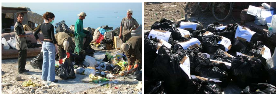
Figure 3- Opération de tri des déchets sur le site de la décharge

L'opération consistait à séparer manuellement les déchets selon les catégories suivantes : plastiques, métaux (ferreux et non ferreux), matières organiques, verre, couche, carton, papier, papier, sacs en plastiques, sacs en nylon, textile, et autres et à peser les différents constituants des déchets selon les catégories mentionnées ci-dessus. Les déchets ont été triés sur une nappe en nylon pour faciliter le nettoyage à la fin de l'opération et séparés les déchets de l'échantillon des déchets présents à la décharge. Chaque constituant était placé dans un sac en plastique réservé à cet usage, avant d'être pesée. Le pourcentage de chaque catégorie de déchets était obtenu en faisant le rapport entre son poids individuel et le poids total. La Figure 3 montre l'exécution de l'opération de tri sur le site de la décharge.