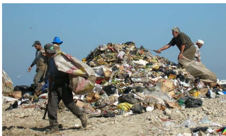
Figure 7- Personnes triant sur le site de la décharge

Les personnes triant sur le site de la décharge ( Figure 7 ) transportent leurs déchets vers les usines de recyclage ou aux commerçants par des pick-up qui viennent jusqu'au site de la décharge. Un petit nombre d'entre eux transportent leurs matières récupérées à bicyclette, en petites quantités.