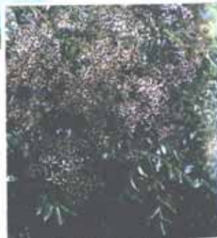
Melia azedarach Chinaberry, Asia